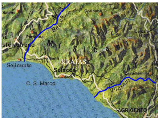
Il territorio del Kratas nel VI sec. a.C.

I Sicani della Sicilia occidentale vissero una storia molto più travagliata perché con l'insediamento dei Fenici a Motya e dei Megaresi a Selinunte (VII sec. a.C.) dovettero ritirarsi dall'estremo lembo dell'isola e fissare il confine occidentale al fiume Hypsas (Belice), mentre con l'arrivo dei Rodi e dei Cretesi ad Agrigento (VI sec. a.C.) dovettero spostare quello orientale dal fiume Himera all' Halykos (Platani).