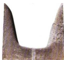
3 simbologia del toro