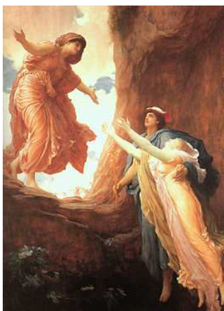
Il ratto di Persefone

Il culto di Demetra si diffuse inizialmente ad Enna, poi a Siracusa, Mégara Hyblaea, Agrigento, Selinunte e la sua immagine venne raffigurata sulle monete di Lentini, Segesta, Panormo e Tindari, ma fu presente anche nel pantheon greco.