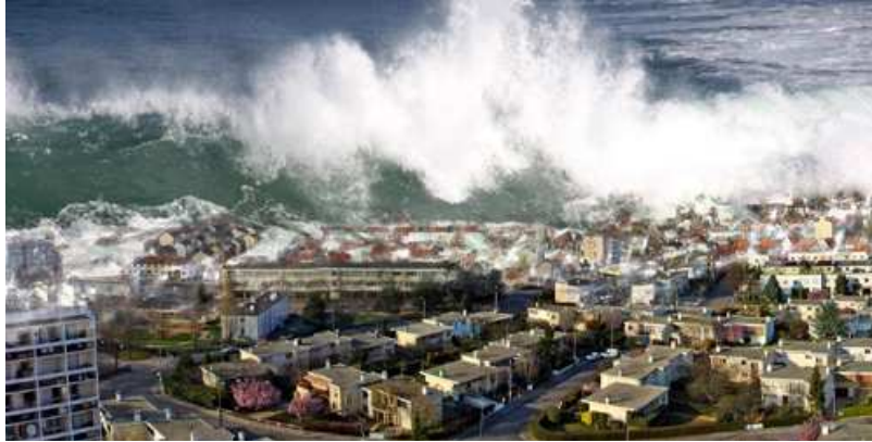
Tsunami del 26.12.2004 nelle isole Maldive

Ancora oggi è vivo il ricordo di quell'onda anomala che il 26 dicembre 2004 devastò 6000 km di costa delle Maldive e della Thailandia, causando 230.000 vittime, e spazzò via tutti i villaggi disseminati lungo i litorali.