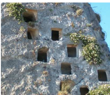
Caltabellotta, necropoli Cappuccini