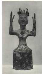
6 Gazi, Creta XV - XIV sec a.C.