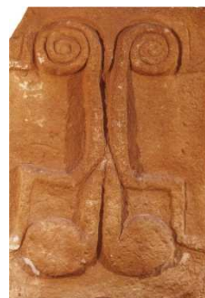
Tombe e portello tombale di Castelluccio - età del bronzo antico