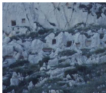
Caltabellotta, necropoli S. Marco