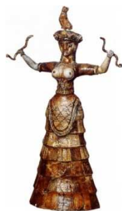
1 Dea dei serpenti

La Grande Madre di Cnosso (fig. 1), accostabile alla Madre Terra di Minet el Beyda di Ugarit (fig. 2), veniva solitamente raffigurata con sembianze umane, con seni rigogliosi, simbolo di fecondità, e nell'atto di stringere una coppia di serpenti, animali dell'Oltretomba. Ad essa erano consacrate le corna di un toro (fig. 3) sacrificato dall'ascia bipenne (fig. 4) e fu durante il periodo dei secondi palazzi (1700 a.C.) che comparve il leggendario Minotauro, un essere con il corpo di uomo e la testa taurina. Tale simbologia si diffuse anche a Polizzello, nel cuore religioso della Sicania.