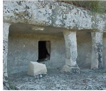
Necropoli di Castelluccio

nelle dimensioni e nel sistema di chiusura, nella volta semicircolare piana e declinante verso l'apertura, dal cui arco scendono svasando le pareti interne curve, sono identiche ad esemplari della necropoli di Castelluccio .