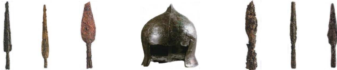
Elmo di bronzo e punte di lance di ferro di Polizzello prima metà VI sec. a.C.

Il santuario ha restituito anche un elmo di bronzo di tipo cretese della prima metà del VI sec. a.C. e nei sacelli dell'acropoli B/4 B/7 B/9 sei punte di lance di ferro della stessa epoca.