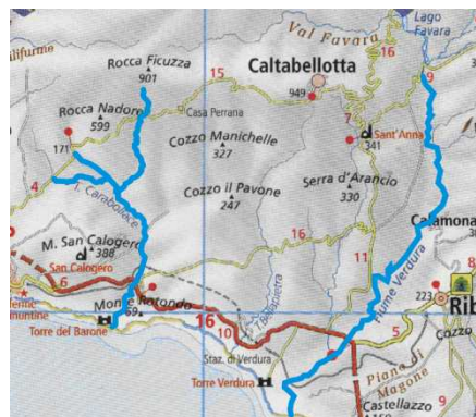
Il territorio del Kratas nel V sec. a.C.

Con l'espansione di Selinunte fino a Monte Kronio (V sec. a.C.) e di Agrigento fino a Minoa (V sec. a.C.) il territorio sicano si restrinse al Kratas il quale venne delimitato dai fiumi Carabollace (ovest) e Verdura (est).