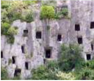
Necropoli Pantalica nord