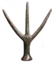
5 Tridente di Polizzello VI sec. a.C.