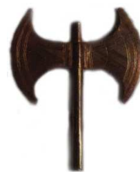
4 ascia bipenne

Il ritrovamento nella Cava di Ispica (Ragusa) di un frammento di pithos minoico con un contrassegno a forma di tridente , simile a quello rinvenuto a Cannatello (XIV sec. a.C.) e la scoperta nel santuario di Polizzello di un bronzetto anch'esso a forma di tridente , databile alla prima metà del VI sec. a.C. (fig. 5), ci riportano alla simbologia della Dea Madre e all'uso cretese (figg. 6, 7) e anche miceneo (fig. 8), Potnia Sito era chiamata la Signora del Grano, di riprodurre idoletti con le braccia alzate.