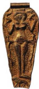
2 Madre Terra