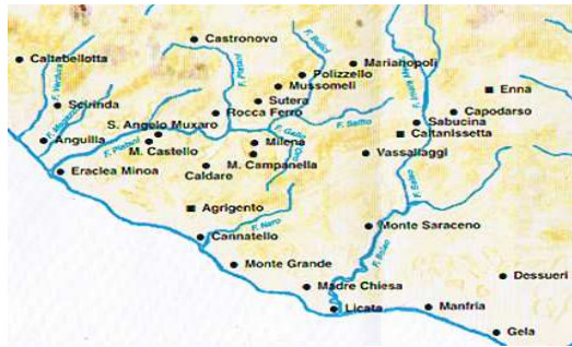
Costa della Sicilia sud-occidentale nell'antica e media età del bronzo

L'archeologia in questi ultimi anni ha intensificato gli scavi sulla costa meridionale dell'isola e molto interessanti si sono rivelati quelli fatti da Giuseppe Castellana 21 a Monte Grande (Palma di Montechiaro) da cui è emersa un'immagine della Sicilia del II millennio