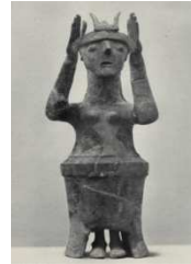
7 Karphi, Creta XII - XI sec. a.C.